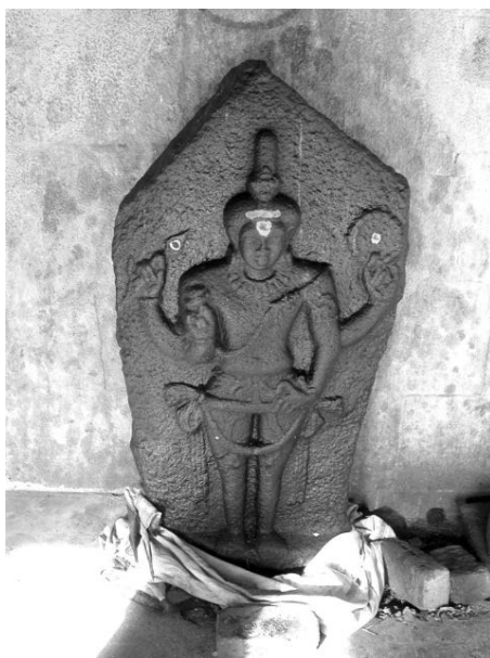
Fig. 9. Le Murukaṅ-Skanda d'Elavanacūr-kottai, VIII e -IX e s. (cliché: ÉFEO / N. Ramaswamy).