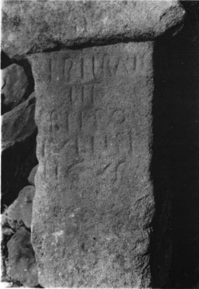
Fotografía N.º 1. ZORITA (Cáceres)

Dimensiones: Altura 75 cm. Anchura 37 cm. Grosor 27 cm. Neto inscrito 30 cm. Altura de las letras 5'5 cm. Anchura de la moldura superior 17 cm. Ancura de la moldura 47 cm.