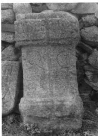
FOTOGRAFÍA N.º 2. «Aldehuela de Mordazo», TRUJILLO (Cáceres).

LIBER LIB [ era ] / Q (vintvs) C(aecilivs) [ ð Q (vintvs) [ et ] C (aivs) ] / EX V (voto).