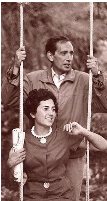
Miguel Delibes y Ángeles de Castro.

Difícilmente se puede decir con mayor claridad y sencillez, esa difícil sencillez a la que me refería antes. Por todo ello, y tanto que no cabe aquí, Miguel Delibes fue un escritor cuyo estilo vital y literario, felizmente unidos e inseparables como las alas del pájaro al vuelo, alcanzó esa difícil sencillez que tan sólo consiguen esos pocos sabios que no dejan de ser fieles a sí mismos. Por todo ello creo que la alargada sombra de su literatura, esa estremecida e inquietante proyección de su mundo interior, nos seguirá acompañando.