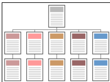
La struttura gerarchica

La struttura da utilizzare per una gran mole di testi è la gerarchica.