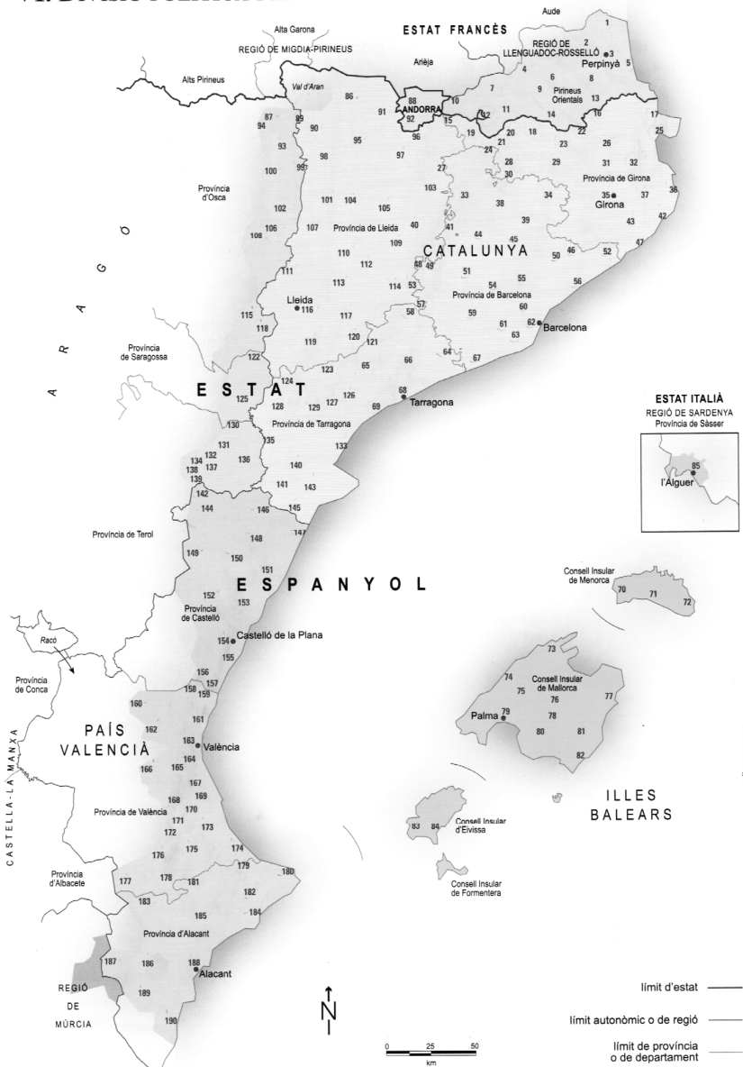
Mapa 2. División política y administrativa