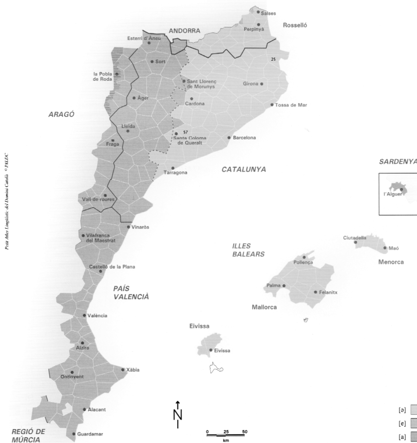
Mapa 4. Mapa fonètic: distribució de timbre de la vocal final -e en los masculinos

[ə] va passar a [a], vocal també central. Poblacions de frontera entre cat. occ. i cat. oriental, com Aguiló (57), alternen la neutra [ə] amb una variant un xic palatalitzada [ə̟]. En el cas de Roses (25), una part de la població, especialment la vinculada al món mariner, ha palatalitzat la [ə] final tant de masculins com de femenins ( colz[ɛ] , però també cas[ɛ] ).