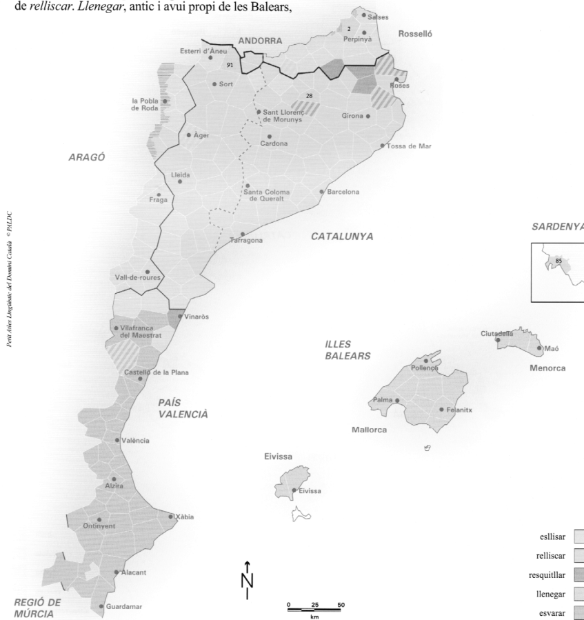
Mapa 5. Mapa léxico: distribució de Relliscar

deriva del llatí. LENIS 'suau, llis al tacte', que hauria donat *llen i, a partir d'aquí, *esllisar, *llenar, *llenar, per arribar al derivat llenegar (com de batre → bategar , de tossir → estossegat , etc.). Esvarar , estès pel valencià, s'ha format sobre el llatí. VARUS 'garrell', precedit del prefix es- , pel fet de quedar-se el qui rellisca com obert de cames. Formes puntuals: patinar (91), pròpiament 'relliscar amb patins sobre una superfície llisa' o 'relliscar les rodes d'un vehicle', s'ha cobert eventualment del significat general 'relliscar'. llenegar : glissar (2) és importat del fr. glisser , i l'alguerès esquiritjar (85), que alterna amb esquiritjar , és un sardisme.