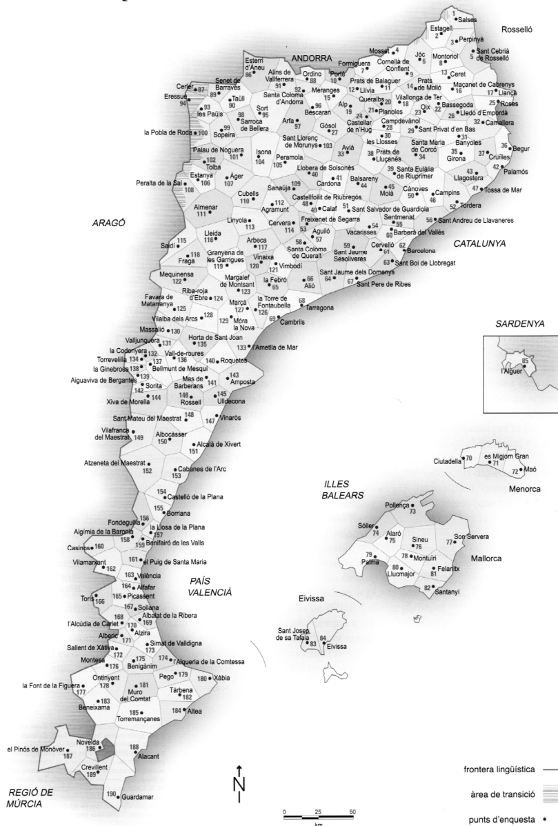
Mapa 1. Puntos de encuesta