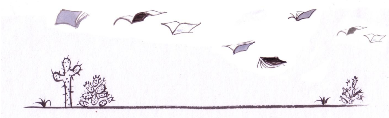
Ilustración: Ana Campos

Dicen que en algún lugar, suspendida por hilos de cuentos, planea, viene y va, la biblioteca voladora. Que sus libros parten en bandadas, siguiendo al viento. Dicen que antes de su llegada, se hace un silencio rarísimo, que poco a poco va llenándose de historias, letras que caen como lluvia fina, frases que revolotean, versos como halcones funambulistas, que se suspenden entre nube y nube. Bandadas de libros, que van de Norte a Sur, de Oeste a Este, llevando historias viajeras, cuentos y poesía a los rincones más lejanos. Cuentan, que para reponerse de sus largas travesías, buscan un lugar reparado para anidar. Allí se quedan, hasta que de las historias nacen historias y sueños de las poesías. Cuentan que sólo entonces, la bandada de libros bate sus hojas y una vez más, alza el vuelo.