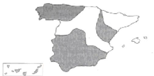
FIGURA 2. Mapa del territorio español en donde se produce el yeísmo coloreado en gris

El área estudiada es la ciudad de Gandía, situada al sur de la provincia de Valencia y a apenas 10 kilómetros de la provincia de Alicante. Se encuentra situada en el centro del dominio lingüístico del valenciano. Como se puede observar en la Figura 2 (Castelli & Mosonyi 2010) Gandía pertenece a la zona distinguidora.