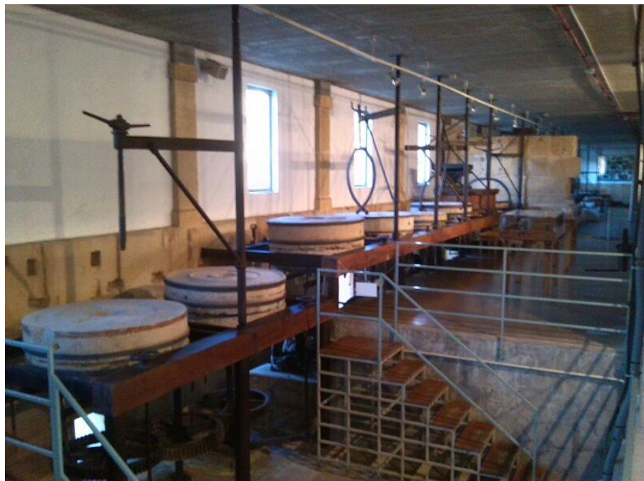
Fig. 1. Vista de las piedras de moler de Los Molinos Nuevos de Murcia.

longitudinal para no dificultar el paso de las aguas. Para la entrada del agua se construyó un canal y un azud que derivaba las aguas al edificio nuevo que contaba con un total de 21 ruedas, que fueron ampliadas en el año 1808 con tres ruedas nuevas, aguas abajo de las anteriores.