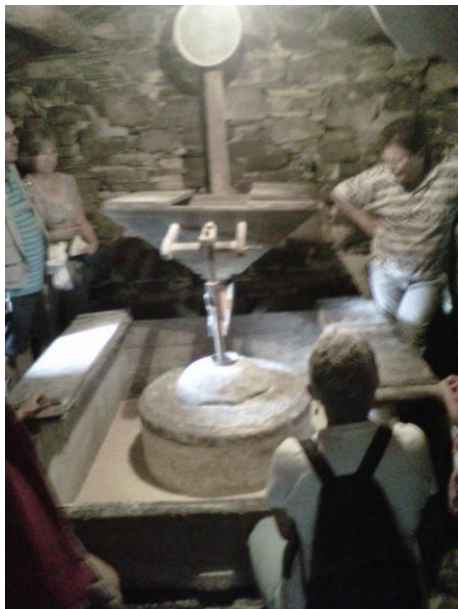
Fig. 3. Visita guiada al molino del Conjunto de Teixois en Taramundi.