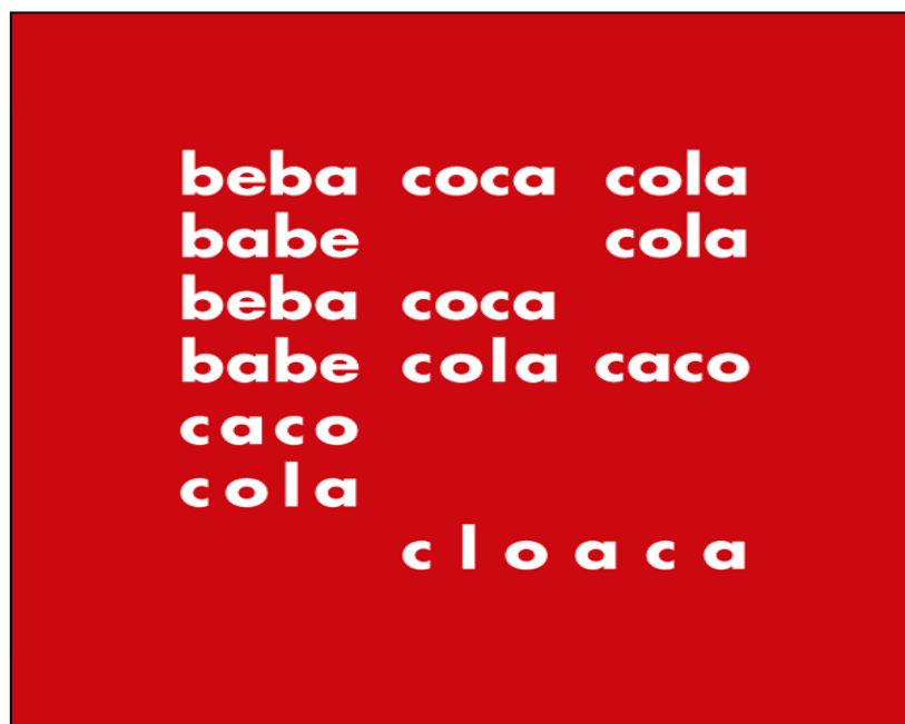
Figura 2. Beba Coca-Cola (1957) di Décio Pignatari 4

Ciò non esclude, tuttavia, da parte del poeta concreto di esercitare una critica dall’interno e di sollecitare nello spettatore/fruitore una riflessione attiva sui meccanismi alienanti delle società tardo-capitalistiche di stampo consumistico e sul potere di manipolazione di quegli stessi mezzi e tecniche di propaganda iconici usati dai mass media .