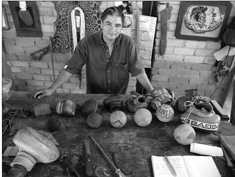
Fig. 6 La evolución de guantes y pelotas de 1910 a 2008.

ven hoy en día en los guantes, fueron inventadas por Agustín Pacheco, inspirado por las grecas prehispánicas que había visto en el sitio arqueológico de Mitla.