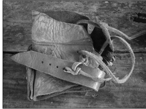
Fig. 5 Un guante de pelota mixteca de hule de alrededor de 1930.