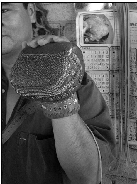
Fig. 1 Un guante de pelota mixteca de hule.

El juego de pelota mixteca tiene tres variantes: pelota mixteca de hule, pelota mixteca de ferro y pelota mixteca de esponja (denominada también pelota mixteca del Valle) (Scheffler, Reynoso e Inzúa 1985; Turok 2000). Estas variantes se distinguen sobre todo por los implementos usados para el juego, más que por los reglamentos.