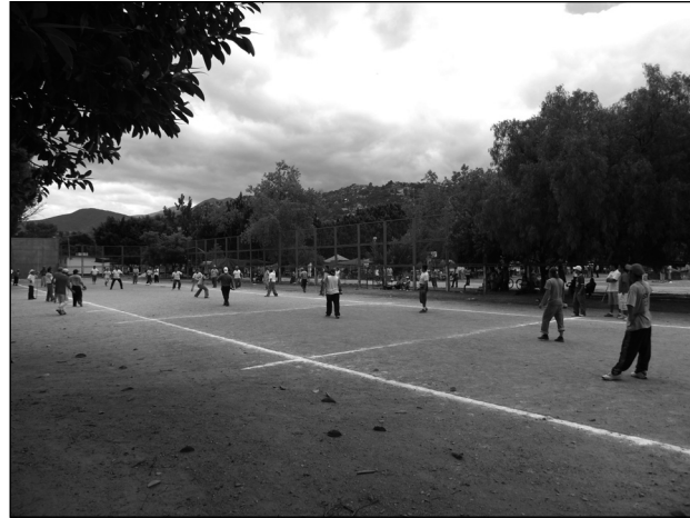
Fig. 2 El pasajuego de pelota mixteca. Fig. 3 El pasajuego de la ciudad de Oaxaca.

La zona de saque cubre unos 70 metros, el cajón aproximadamente 8 metros, la zona del resto abarca el resto de la cancha. Los equipos, normalmente integrados por cinco personas y también denominados quintas , son nombrados según la zona en la que juegan, así que el equipo en la zona de saque se llama saque o contrarresto y el equipo en la zona del resto se llama resto . Dentro de la zona de saque, a una distancia de entre 30 y 40 metros del cajón, se ubica la botadera , una piedra inclinada en la que se hace botar la pelota para efectuar el saque. Como el saque debe alcanzar el cajón, la distancia entre el cajón y la botadera varía dependiendo de la fuerza del jugador que efectúa el saque.