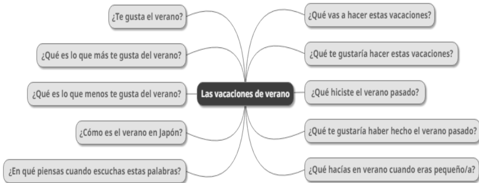
Figura 2. Cuestiones sugeridas a los alumnos para la realización de la actividad 4/3/2

Ante la dificultad de registrar todos los discursos producidos (seis series de 13 discursos simultáneos, 78 en total), se decidió realizar la actividad en un aula de medios audiovisuales. Cada participante dispuso de un ordenador con micrófono, auriculares y un software instalado con el que se grabaron los discursos producidos. Por su parte, el profesor se encargó de dirigir y coordinar el desarrollo de la práctica mediante el uso de un ordenador central. De esta manera, el docente fue asignando a cada participante su compañero correspondiente en cada fase de la prueba. Por