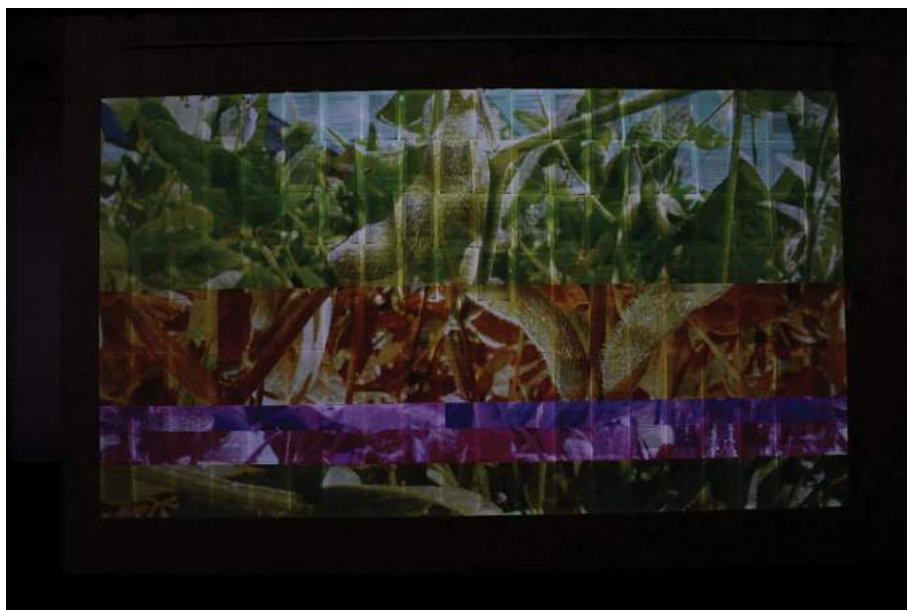
Fig. 2. Benech, Laura. Exposición “Código Base”. Paisajes . http://obraas.net/codes/documentacion/codigo_base/

por una preocupación vinculada a lo viviente, en particular, sobre la industria de la alimentación y la intervención matemática de tecnologías en el terreno rural. Los paisajes de campos de soja fotografiados migran por dos caminos: la rentabilidad de empresas transnacionales que se nutre de territorios de descarte para enriquecer el mercado biotecnológico y el del arte contemporáneo que se sirve del excedente visual —la materialidad del lenguaje del código— para darle lugar a una lectura desviada de un problema de centralidad local: ¿Qué idea de naturaleza se proyecta cuando las semillas migran a objeto de diseño tecnocientífico?, ¿cómo se modifica el vínculo con el paisaje local al ser alterado por la mercantilización global?