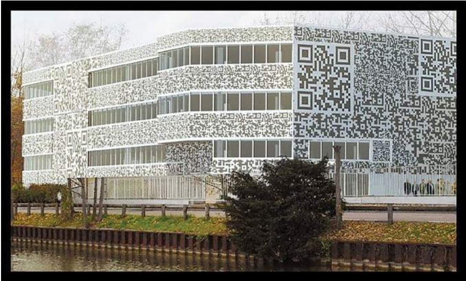
Fig. 5. Beiguelman, Giselle. Sin nombre, http://www.desvirtual.com/esteticas-do-codigo-das-escrituras-urbanas-as-imagens-premediadas-aula-4-auh5862/ .

necesitan ser traducidos mediados por la tecnología. Se disemina así la función de la traducción ante una exigencia propia del mundo contemporáneo, se traslada el sentido hacia otros territorios. Siguiendo a Romano Sued, en un contexto de tecnoglobalización, resulta inevitable pensar en las formas en que las palabras migran interculturalmente en el marco de los objetos que las albergan: “La diáspora entendida como exilio —de pueblos, lenguas y culturas— alberga igualmente el significado de “diseminación”, de semilla dispersa que germina allende los sitios y épocas de origen” (“Migrancias y travesías ...” 1).