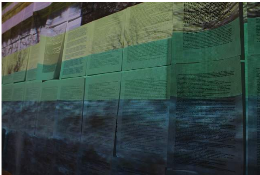
Fig. 7. Benech, Laura. Exposición “Código Base”. Paisajes . http://obraas.net/codes/documentacion/codigo_base/ .