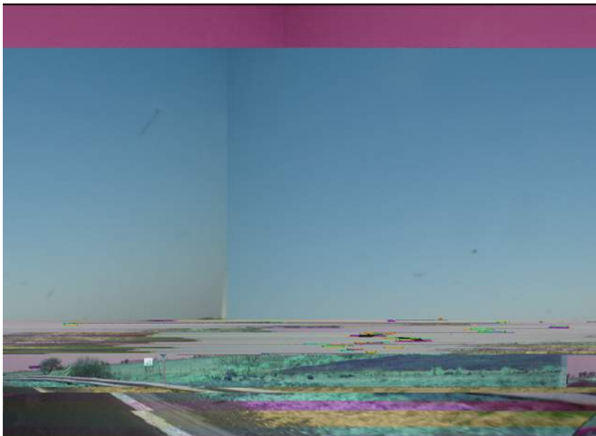
Fig. 6. Benech, Laura. Exposición “Código Base”. Paisajes . http://obraas.net/codes/documentacion/codigo_base/ .