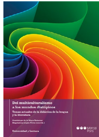
ROCÍO MARAVÉ LANDERO