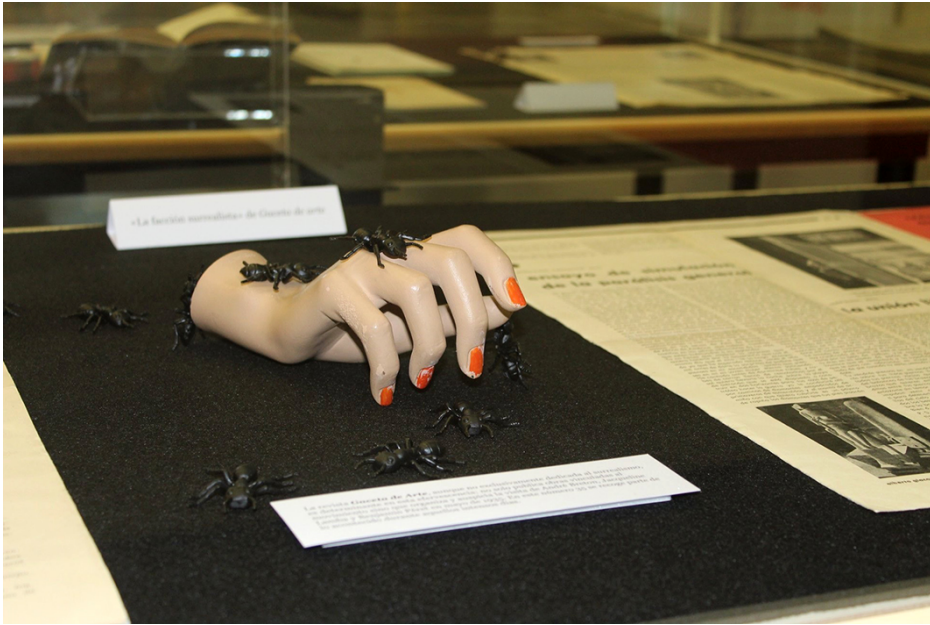
Detalles de la exposición.