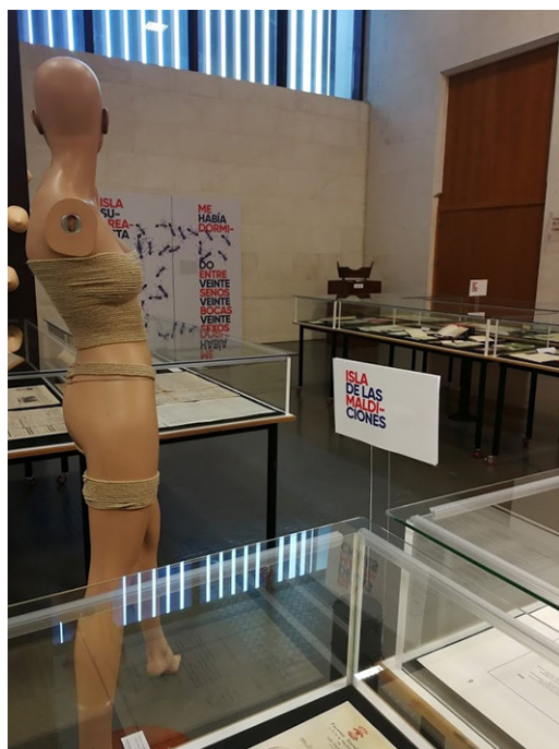
Detalle de la exposición.

que se vivió en Canarias en los años veinte y treinta del siglo xx. De este modo, el hall de la Biblioteca se convirtió en un singular archipiélago cuyas vitrinas se agruparon alrededor de tres nombres: «Isla Vanguardista», «Isla Surrealista» e «Isla de las Maldiciones», cuyo recorrido permitía al público vislumbrar la evolución de nuestros artistas y escritores. Desde este planteamiento, la «Isla Vanguardista» refleja los primeros tanteos con los diferentes ismos —especialmente el creacionismo y el cubismo—; la «Isla Surrealista» da cuenta de la inmersión radical en la aventura bretoniana —que, para nosotros, como para sus protagonistas, era algo diferente a la experiencia anterior—; y, en fin, la «Isla de las Maldiciones», título tomado de uno de los más espeluznantes capítulos de Crimen , la obra cumbre de Espinosa, pretende recordar el descenso a los infiernos —de la censura, la muerte o del exilio— que supuso para nuestros autores, y muy especialmente para nuestro protagonista, el estallido de la Guerra Civil.