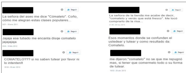
Imagen 1. Percepción sobre el uso de cómatelo en Twitter

Tradicionalmente la literatura y los hablantes concuerdan en condenar las alternancias intra verbales como ‘errores’ propios de grupos marginados, clases populares, campesinos, sujetos con nivel de estudios bajo e individuos que no saben tutear, tal como se observa en las siguientes publicaciones de Twitter: