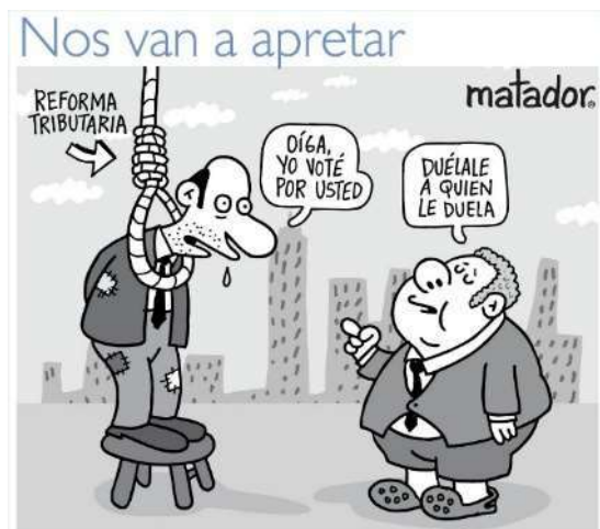
Imagen 1. Caricatura política: Nos van a apretar , de Matador