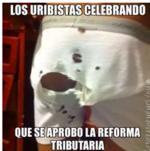
Imagen 2. Meme. Los uribistas celebrando que se aprobó la Reforma tributaria.