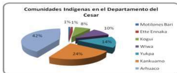
Gráfico 1. Comunidades Indígenas en el departamento del Cesar . Fuente: (DANE, 2005; OIK, 2006)

Las comunidades indígenas que se encuentran en el Departamento del Cesar están repartidas en siete etnias, que a su vez se distribuyen en catorce resguardos. La gran mayoría de estas etnias se diseminan a lo largo y ancho de la Serranía del Perijá y La Sierra Nevada de Santa Marta; y otros más en municipios cercanos a estos lugares, como Valledupar, Becerril, Codazzi, etc. Según el censo de 2005, se registra la existencia de siete etnias en el departamento: ette ennaka, motilones bari, kogui, wiwa, yukpa, kankuamo y arhuaco (Gobernación del Cesar, 2009). Según datos del Censo 2005, se estima que la población con mayor porcentaje demográfico es la comunidad arhuaca (42 %), mientras que la comunidad kankuamo ocupa el segundo lugar (24 %) de población indígena en el Departamento del Cesar.