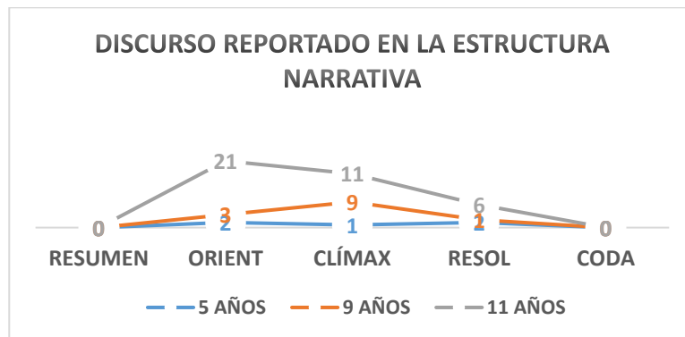
Gráfico 2. Número de instancias de discurso reportado en las secciones de la narrativa

El Gráfico 2 muestra la inserción del discurso reportado en la estructura narrativa y el número de instancias que este recurso presenta en el corpus de esta investigación.