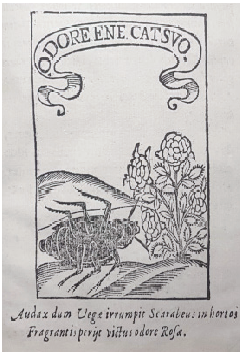
Fig. 1. Columbario, Expostulatio Spongiae , fol. 61r 40 .

La misma que presenta la editio princeps de La Dorotea :