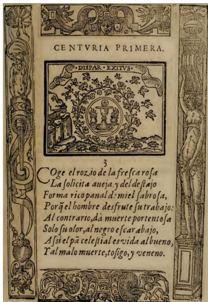
Fig. 4. Covarrubias, Emblemas morales , I, 3.

Y uno de los Emblemas morales de Sebastián de Covarrubias: