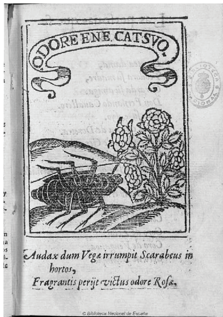
Fig. 2. Lope de Vega, La Dorotea , s. p.

El sentido, desde lo anterior, no es difícil de descifrar: el rosal o Lope fulmina al escarabajo o Torres Rámila 41 .